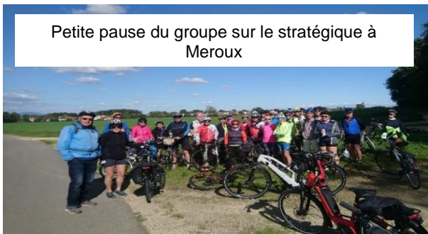
Petite pause du groupe sur le stratégique à Meroux

Nous vous donnons donc RDV au printemps prochain pour passer de bons moments sur nos deux roues !