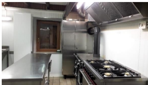
La nouvelle cuisinière bois et la nouvelle gazinière à 5 feux.