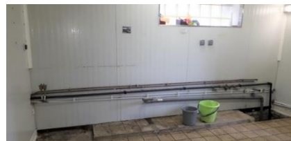
La cuisine a été vidée de tous ses éléments