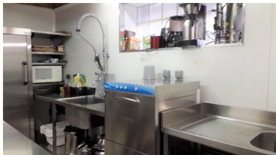
Les nouvelles plonges et le lave-vaisselle